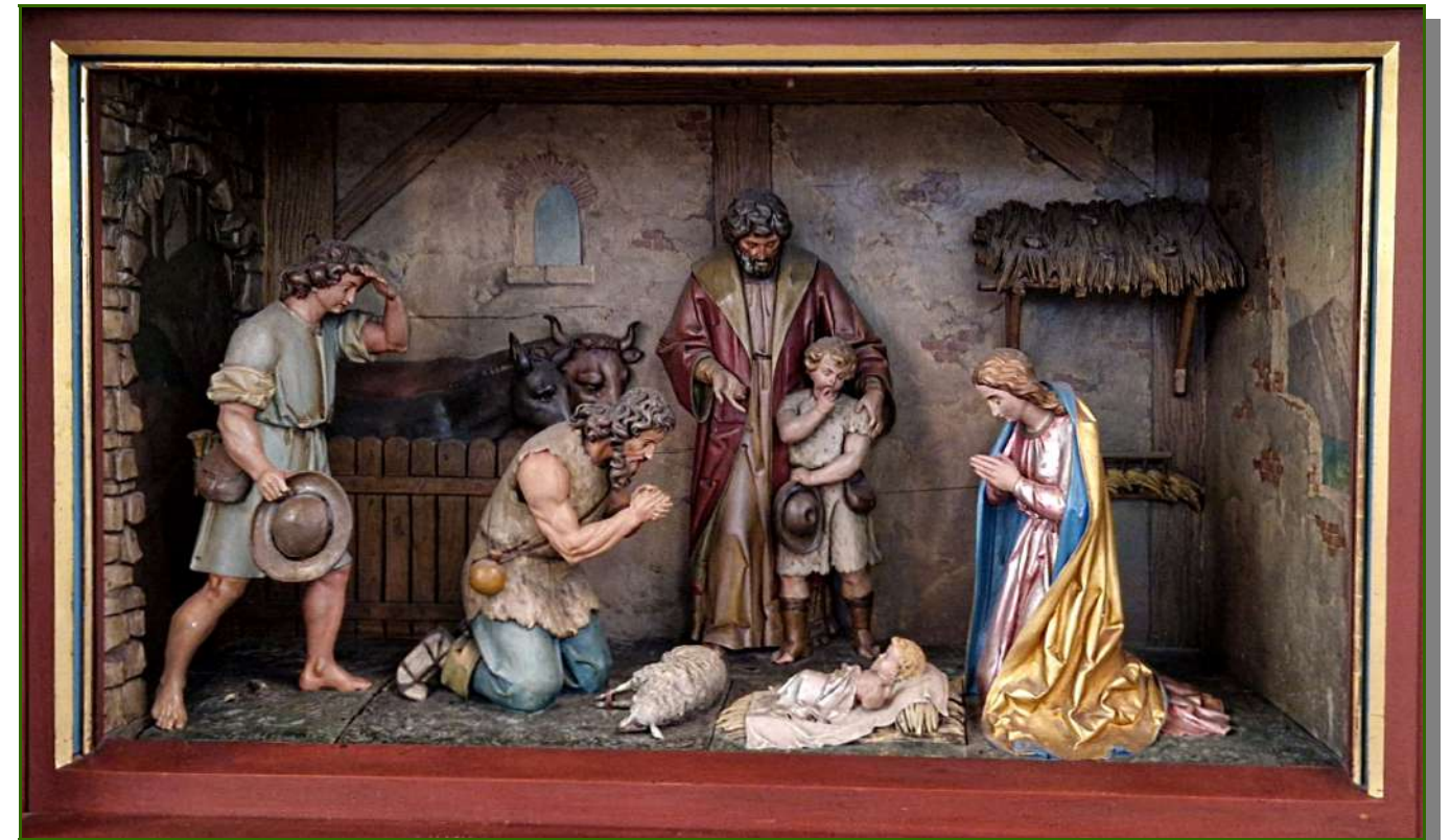
Weihnatskrippe im Hochaltar unser Kirche Maria Himmelfahrt.

Wir wünschen Ihnen und Ihren Familien frohe Weihnachten und alles Gute im neuen Jahr.